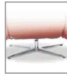
Kreuzfuß, Stahl nickel-satinier - FU 4., Aufpreis F U4.