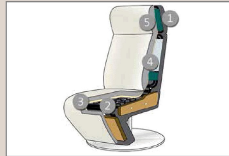
Das Design des hier abgebildeten Querschnitts entspricht nicht dem Modell dieses Katalogblattes.