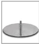
Tellerfuß - versch. Metallfarben - FU 2., Aufpreis F U2.