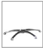
Sternfuß Chrom glänzend - FU 1 F U1